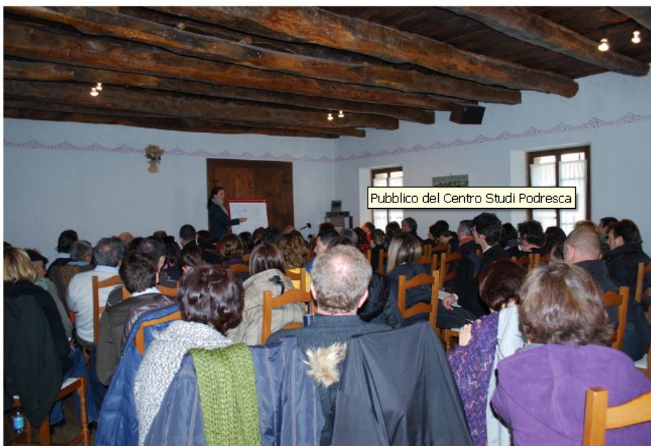
Pubblico del Centro Studi Podresca